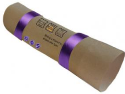
Roll-Up Selection Box

verre d'huile d'argan. L'entrée est un excellent exemple de l'ingénierie du carton en raison de son système de protection sophistiqué composé de poches d'air qui aident à protéger le produit contre les dommages pendant le transport, ce qui lui permet d'être livré par la poste.