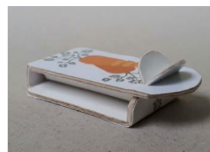
Sac à pain Eco Seal