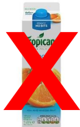
Emballage des liquides